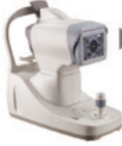
► Göz Ultrasonu