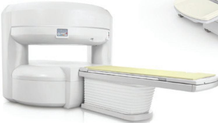
► Açık Emar