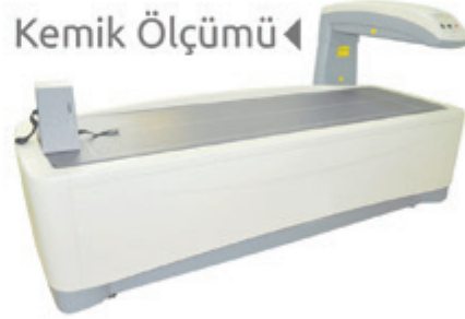
Kemik Ölçümü ◀