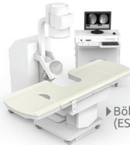
► Böbrek Taşı Kırma (ESWL)