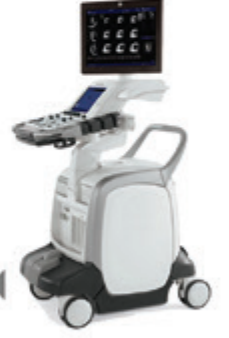
Eko Kardiyografi ◀ (Kalp Ultrasonu)