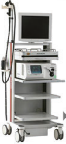
► Endoskopi Kolonoskopi